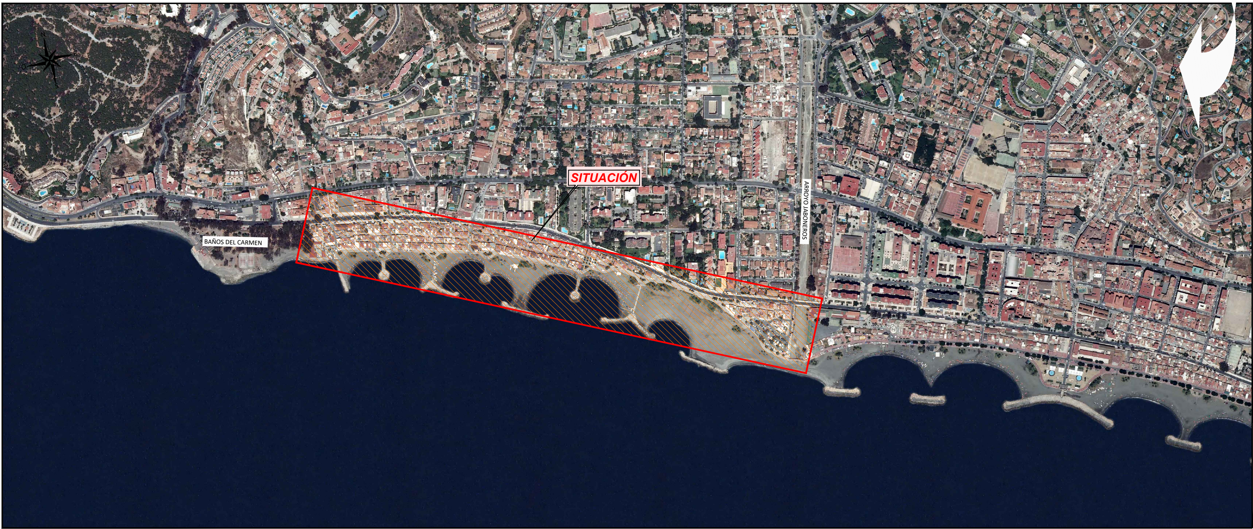
EMPLAZAMIENTO ESCALA 1:5.000