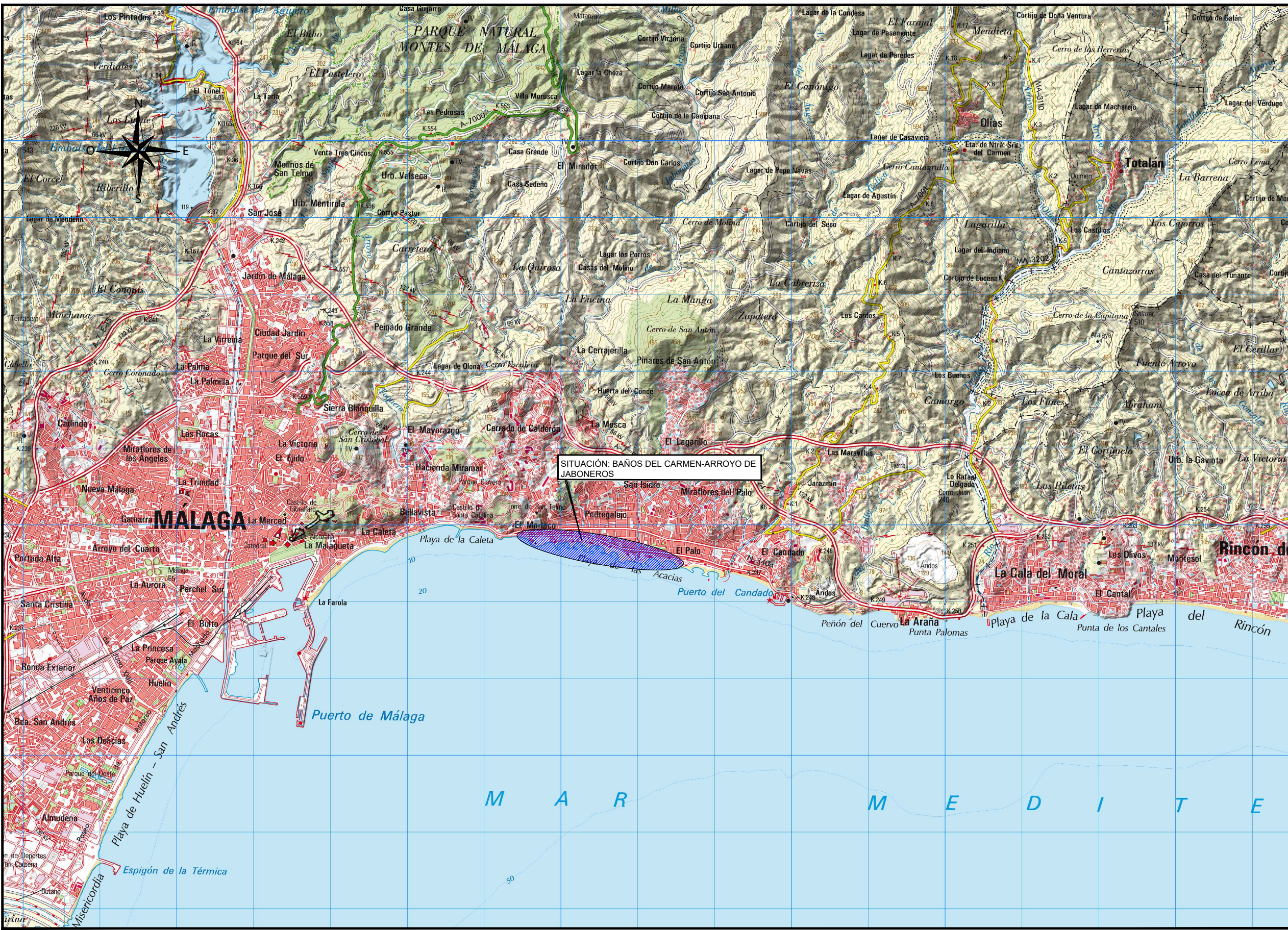
SITUACIÓN ESCALA 1:50.000